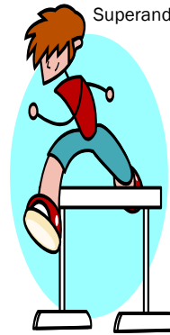
Superando los tropiezos